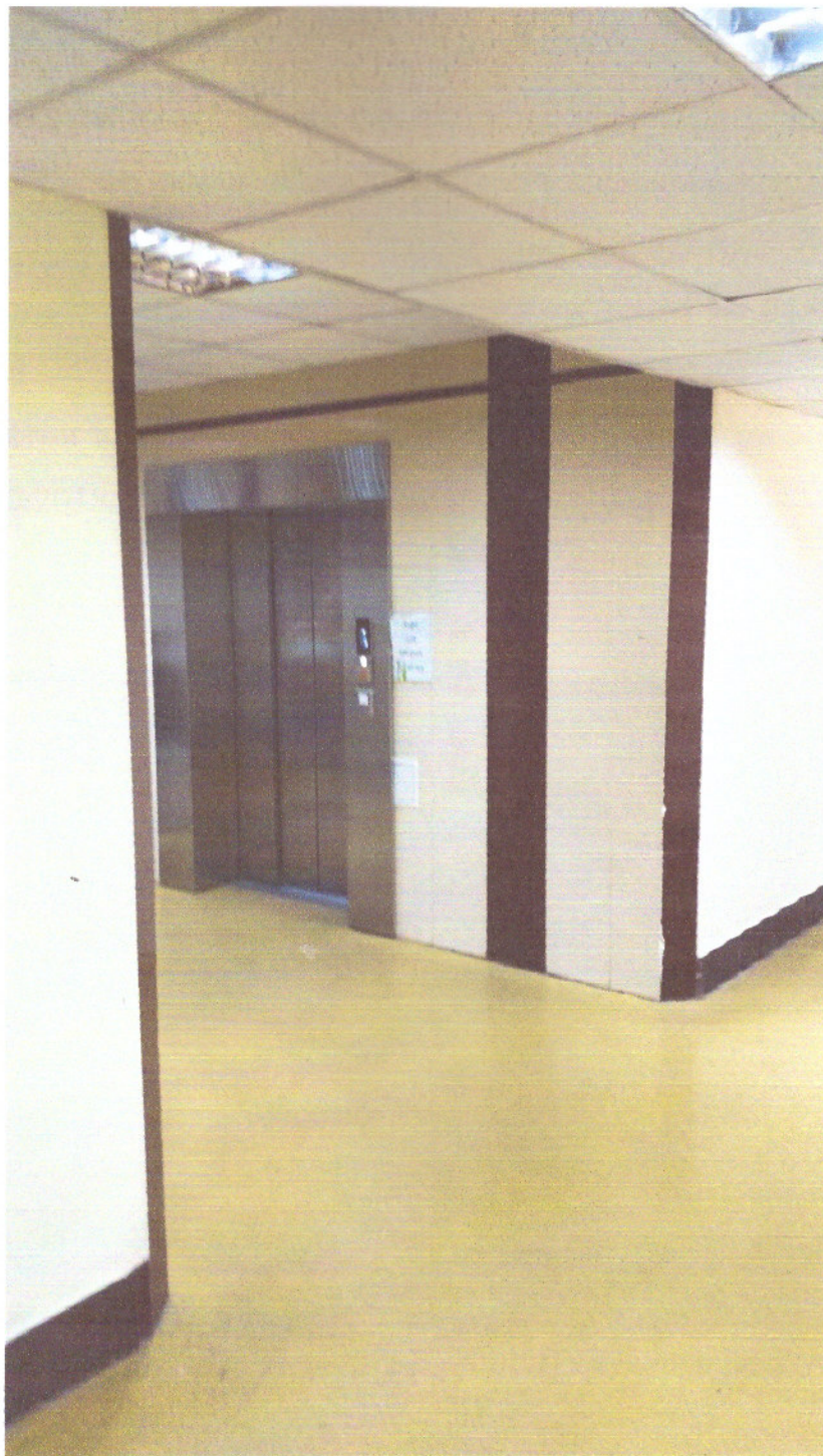
Рисунок 1.3 Загальний вид ліфтового холу (Лікувально-палатний корпус)