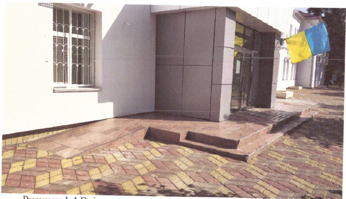
Рисунок 1.4 Вхідна група до Адміністративного корпусу будівлі

Параметри вхідної групи будівлі та приміщень відповідають вимогам ДБН В.2.2-40:2018 Інклюзивність будівель і споруд [2].