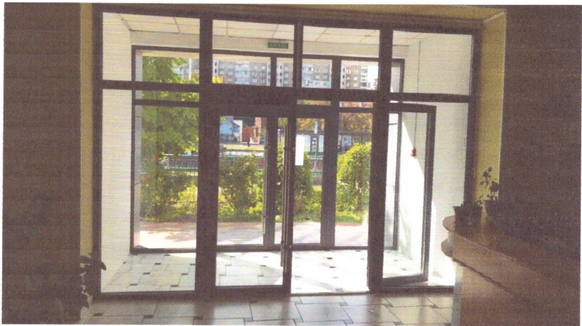
Рисунок 1.5 Тамбур вхідної групи адміністративного корпусу