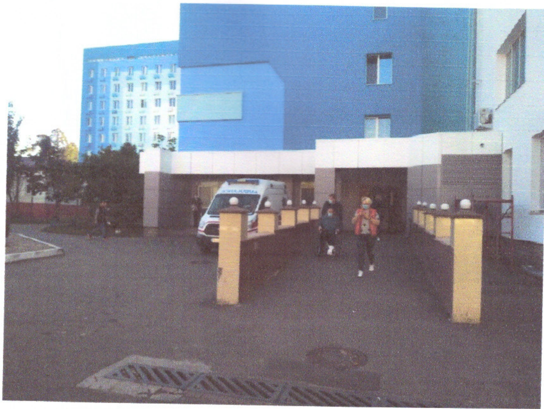
Рисунок 1.1 Вхідна група головно входу будівлі (Лікувально-палатний корпус №1, Лікувально-хірургічний корпус №2, Лікувально-діагностичний корпус №26) за адресою: вул. Харківське шосе, 121, м. Київ