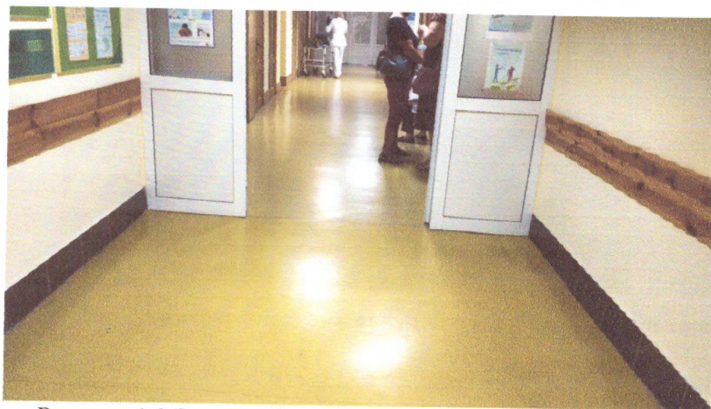
Рисунок 1.2 Загальний вид коридору 1-го поверху будівлі